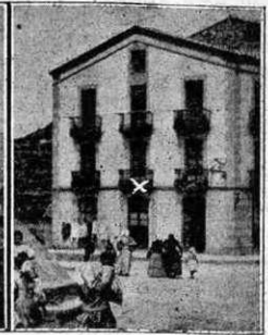
Casa ont va neixer en Max-Linder