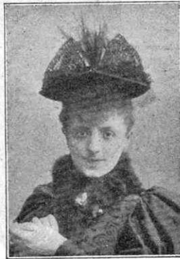
La mare d'en Max-Linder