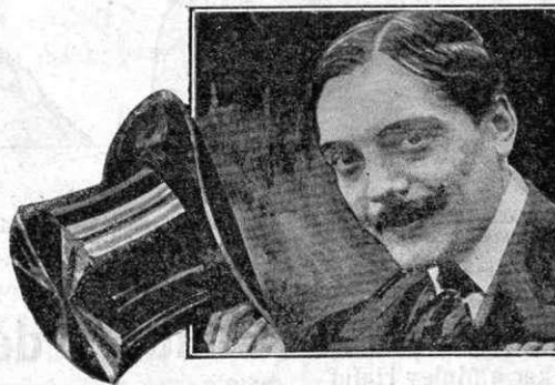
En Max-Linder en l'actualitat

Al hotel de Marsella ont últimament residia—convertit en diposit general de les seves adquisicions,—les caixes y els bultos hi entraven a carretades.