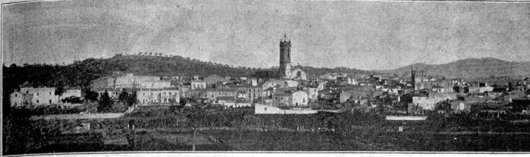
Vista total de Saint-Loubés, població nadiua d'en Max-Linder.